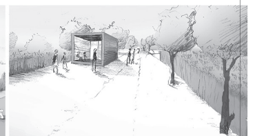
Blick in die Rheingärten