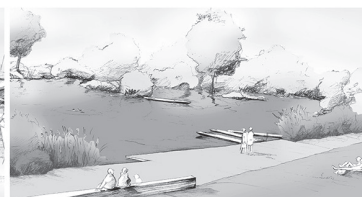
Platz am Wuhloch