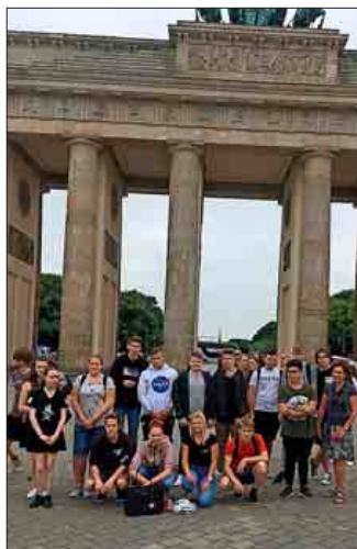
Vor dem Brandenburger Tor