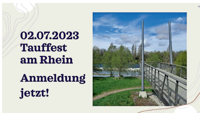
Taufest am Rhein 2023

Wer sein Kind oder sich selbst am Rhein taufen lassen möchte, hat am 02.07.2023 die Gelegenheit dazu. Wir wollen nach den Coronajahren wieder an den Rheingärten ein Fest feiern, bei dem jeder getauft werden kann, der sein Kind zu Gott bringen will bzw. jeder Erwachsene oder Jugendliche, der bewusst eine Entscheidung für Jesus getroffen hat. Anmeldung über unser Pfarramt: 07631-799119 oder Pfarramt@KircheNeuenburg.de