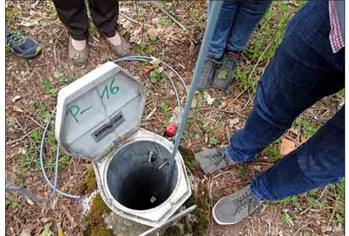
Grundwassermessstelle in Neuenburg am Rhein

Alle am Workshop Beteiligten zeigten großes Interesse, sich in das Citizen-Science-Projekt auch weiterhin einzubringen und die Landesgartenschau Neuenburg am Rhein 2022 damit aktiv zu unterstützen – ein riesiger Erfolg. Um das Projekt in die Tat umzusetzen, ist nun eine organisatorische Basis zu schaffen, d.h. konkret einen Raum mit Waschbecken oder eine Ausleihstation in Neuenburg am Rhein zu finden, so dass die Ehrenamtlichen an die benötigten Arbeitsmaterialien zur Probeentnahme und die Stereomikroskope zur Auswertung kommen können. Die Projektteilnehmer werden selbstverständlich weiterhin von Dr. Cornelia Spengler betreut und können sich mit Fragen jederzeit am besten per Mail an sie wenden. Weitere Zusammenkünfte und Workshops – auch für zukünftige Interessierte – folgen.