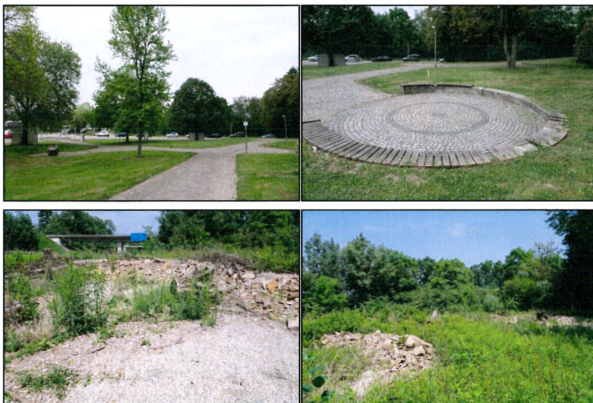
Abb. 2: Beispielansichten des Planungsgebiets (oben) und der potenziellen Ausgleichsfläche für Reptilien (unten).