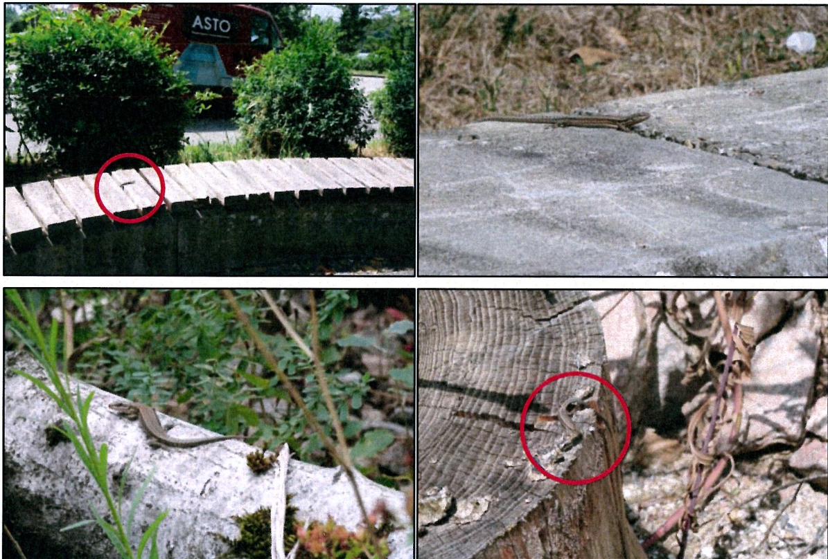
Abb. 4: Beispielfotos von Mauereidechsen im Planungsgebiet (oben) und auf der potenziellen Ausgleichsfläche (unten).

Die potenzielle Ausgleichsfläche bietet bereits einige sehr gut als Sonnplätze und Versteckmöglichkeiten geeignete Strukturen. Im Umfeld der potenziellen Ausgleichsfläche ist weiteres geeignetes Habitat vorhanden, insbesondere an und auf dem stillgelegten Bahndamm. Hier wurde ebenfalls eine Mauereidechse gefunden, obgleich die Gleisanlagen nur kurz begutachtet wurden. Stellenweise ist das Sukzessionsaufkommen und damit die Beschattung recht hoch, dies schränkt die Habitataignung für die Mauereidechse ein. Insgesamt ergaben die Kartierungen demnach, dass die geeigneten Bereiche auf der Ausgleichsfläche bereits von einer Population der Mauereidechse besiedelt sind. Eine Umsiedlung der betroffenen Population im Planungsgebiet auf diese Fläche ist ohne weitere Maßnahmen daher nicht möglich.