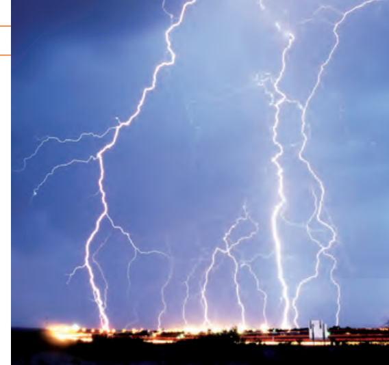
Blitzeinschlag in der Großstadt