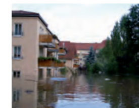
Hochwasser in der Stadt