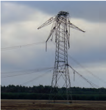
Sturmschaden durch den Orkan Kyrill im Jahr 2007