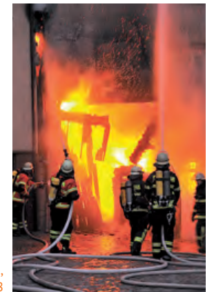
Hausbrand in Monschau, Nordrhein-Westfalen 2008