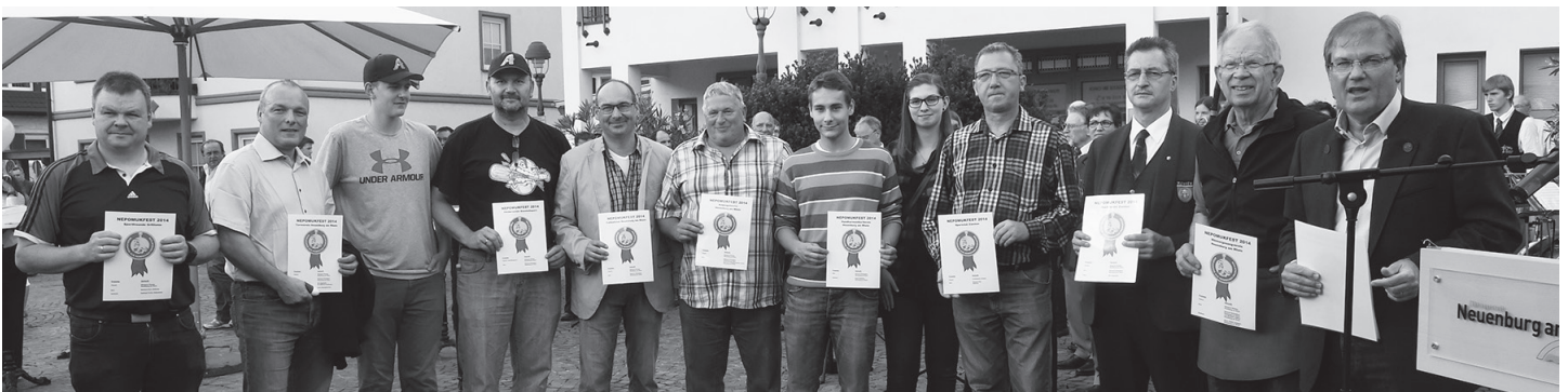
Die Vereine boten Speisen, die aus heimischen Produkten hergestellt werden. Dafür überreichte Bürgermeister ein Zertifikat.