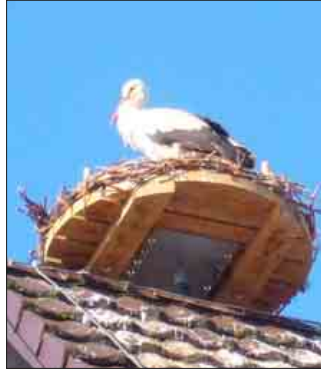
Weißstörche in dem neu eingerichteten Nest auf dem Rathaus Zienken. Mittlerweile brütet die Störchin.