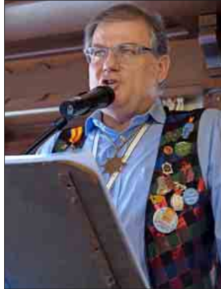
Der Burgi in der Bütt