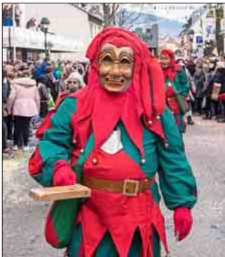
Bunte Narrenschaue: Mehr als 2500 Hästräger aus nah und fern zogen durchs Städtle