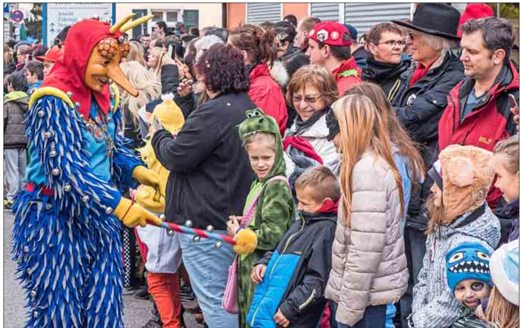
Jung und Alt hatten beim Umzug der „Rhiischnooge“ ihren Spaß. Tausende Zuschauer standen dicht gedrängt entlang der Schlüssel- und Müllheimer Straße