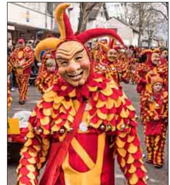
Die Neuenburger Narrencliquen sind zahlreich vertreten, wie die stets grinsenden Altstadtglunkis