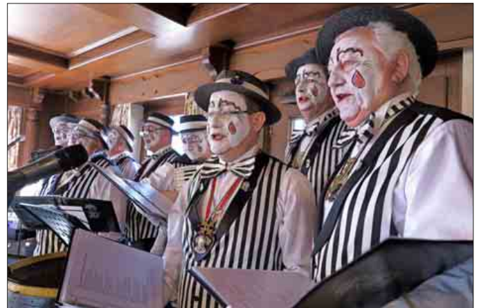
Musikalisch-politische Haue mit Esprit verteilte die BNZ Clownerie