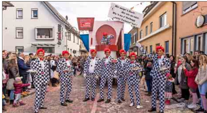
Seit 40 Jahren sind die „Rode Naase“ als Wagenbaugruppe beim Neuenburger Umzug mit dabei. Dieses Jahr warben sie für die „Nette Toilette“ in der Zähringerstadt