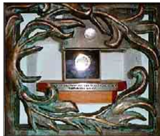
Kunstvoll gestalteter Tresor, in dem die wertvolle Reliquie des heiligen Fridolin Stadtpatron von Neuenburg am Rhein, sichtbar in der Liebfrauenkirche untergebracht ist.