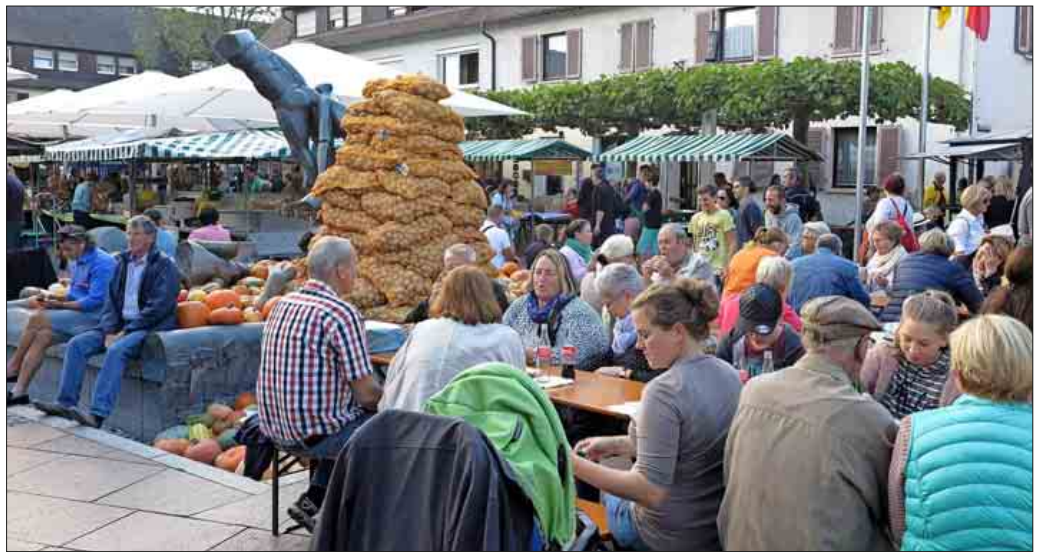
Die Besucher ließen sich die zahlreichen kulinarischen Angebote auf dem Rathausplatz schmecken

felten einlösen konnte. Die Gutscheine, auf denen Name und Anschrift verzeichnet waren, kamen darüber hinaus in die Lostrommel eines Gewinnspiels.