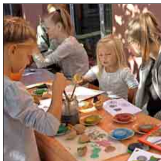
Mit Kartoffeln lassen sich tolle Kunstwerke herstellen

felten einlösen konnte. Die Gutscheine, auf denen Name und Anschrift verzeichnet waren, kamen darüber hinaus in die Lostrommel eines Gewinnspiels.