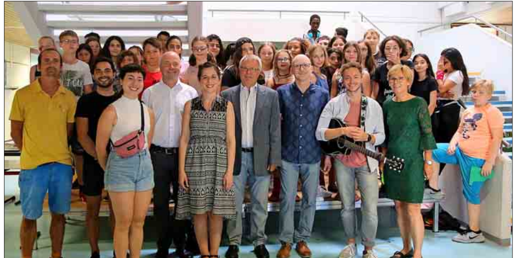
„Bühne frei!“ – im Vordergrund die Projektleiter und Sponsoren

Vier Schauspieler*innen (ge-bürtig aus England, USA und Australien) von dem Theater-projekt Interact leiteten das Projekt und vermittelten den