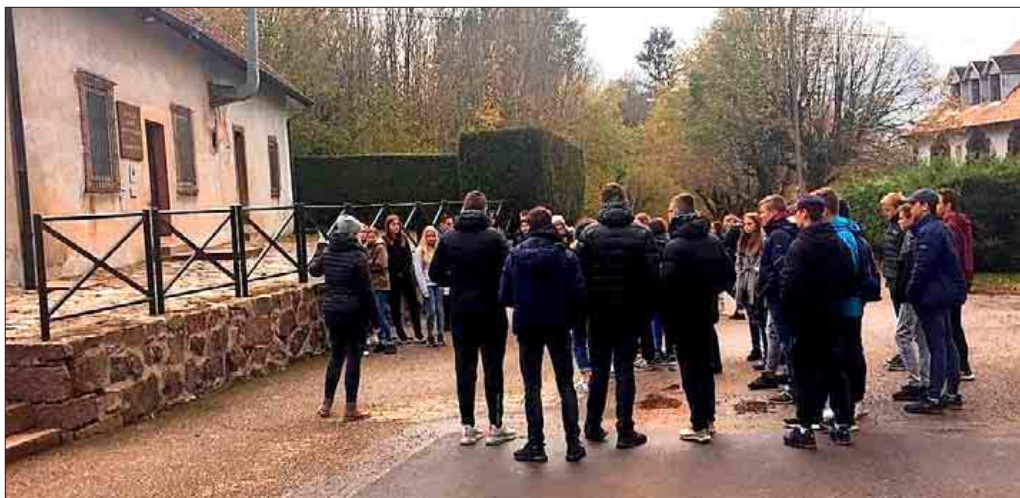
SchülerInnen vor der Gaskammer

Sie besichtigten neben dem Museum acht Schauplätze des ehemaligen Lagers: Die Barracken, den Galgen, den Appellplatz, den Todesgraben, den Arrestbunker, das Krematorium, die Klärgrube und die Gaskammer. Schon die Namen der Orte lassen erkennen, welches Ziel das Lager hatte: Die Vernichtung von menschlichem Leben. Es war zwar ein sogenanntes Straf- und Arbeitslager, aber von den 52.000 Häftlingen, die dorthin zwischen 1941 und '44 deportiert wurden, starben 22.000 an den Haftfolgen,