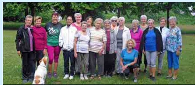
Neue Teilnehmerinnen und Teilnehmer sind beim Wiesensport im Wuhrlochpark immer willkommen.

Das Bewegungsangebot ist für die Teilnehmer kostenlos, eine Anmeldung ist nicht erforderlich. Die angebotenen Übungen sind einfach und können auch während der Woche individuell geübt werden.