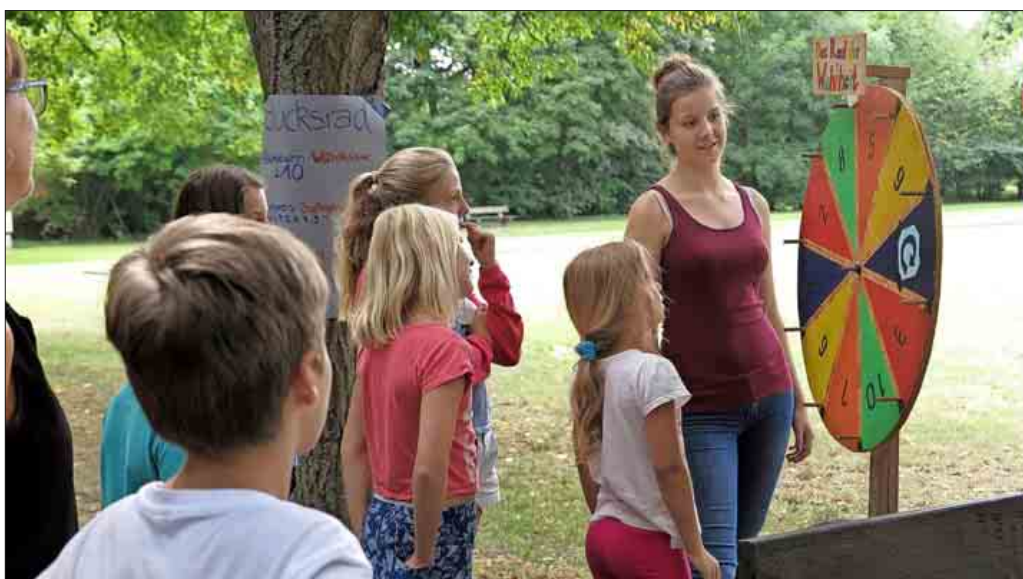
Spiel und Spaß auf dem Spiele-Parcours

rien haben. Auch in diesem Jahr erhalten die Eltern wieder Fragebogen, auf denen sie ihre Wünsche und Anregungen formulieren können. Insgesamt arbeite man jetzt schon im zweiten Kiso-Jahr nach Standards, die man mit den Gruppenleitern erarbeitet und schriftlich formuliert habe, berichtete Gerbig. Diese betreffen Bereiche wie Hygiene, Sauberkeit, Nachhaltigkeit und die pädagogische Arbeit. Schon vor einigen Jahren hatte der Kindersommer neben dem reinen Spaßfaktor auf spielerischem und unterhaltsamem Weg pädagogische Ziele ins Programm integriert wie gesunde Ernäh-