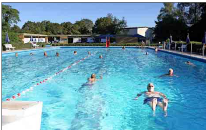
Bewegung und Geselligkeit: Das schätzen die Frühschwimmer an ihrem Morgenritual.

In Steinenstadt ziehen die Frühschwimmer übrigens meist getrennt nach Männlein und Weiblein ihre Bahnen. „Das hat sich irgendwie so ergeben“, heißt es da unter Gelächter aus dem Be-