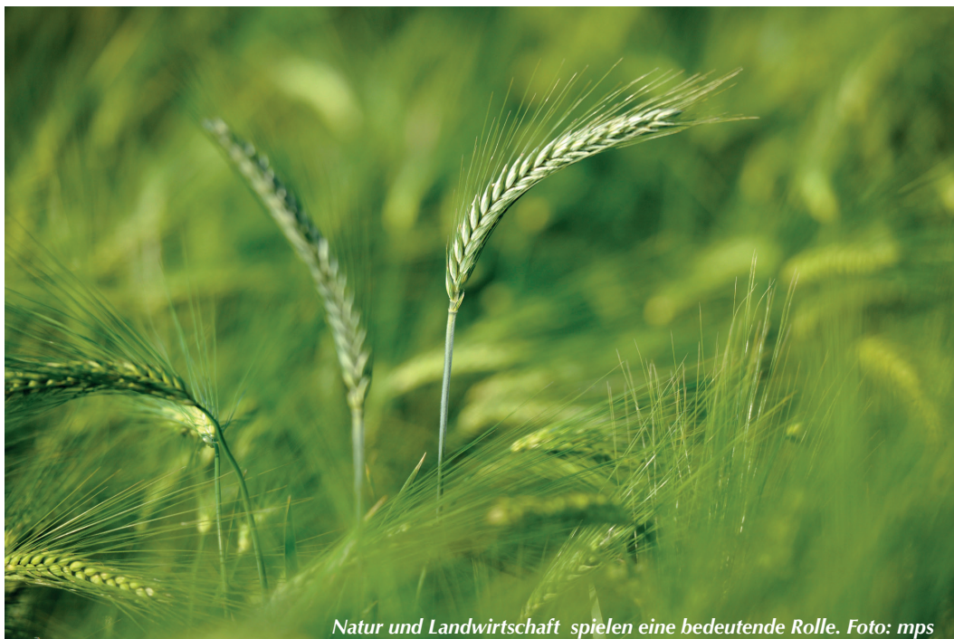
Natur und Landwirtschaft spielen eine bedeutende Rolle.

Einig sind sich alle bei der Charakterisierung der Landschaft als ländlich und natürlich sowie von Wäldern, Feldern und von Reben (Heitersheim) beziehungsweise dem Rhein (Neuenburg, Hartheim) geprägt. Als kritisch werden der Flächenverbrauch und Industrialisierung gesehen, die sich negativ auf Grünzonen, Biotope und Grundwasser auswirken. Insgesamt sehen die Befragten den Rhein mehr als Bindeglied und weniger als Grenze. Ein Thema war auch die Landwirtschaft. Hier bewerten die meisten Bürger das Verhältnis zwischen Landwirten und Erholungssuchenden als akzeptabel, teilweise aber auch verbesserungswür-