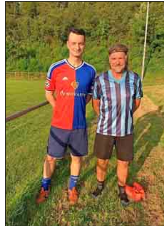
Zufriedenes Trainerduo des FC Steinestadt AH

Die zweite Hälfte war zu Beginn wieder etwas offener. Nach dem Anschlusstreffer der Gäste zum zwischenzeitlichen 3:2 brachte der FC Steinestadt wieder Ruhe ins Spiel und konnte innerhalb kurzer Zeit auf 5:2 davonziehen. In den folgenden 20 Minuten der 2. Halbzeit fielen 3 weitere Tore. Die Partie endete mit 7:3 für den Gastgeber, welcher nun ungeschlagen die Tabelle nach der Gruppenphase