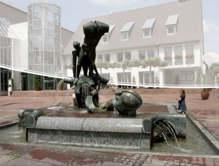
Brunnenanlage Monument (1) auf dem Rathausplatz