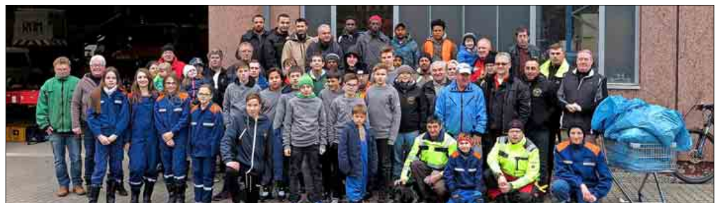
Glückliche Gesichter nach erfolgreicher Arbeit: Die Aktiven bei der jüngsten Stadtputzaktion in Neuenburg am Rhein