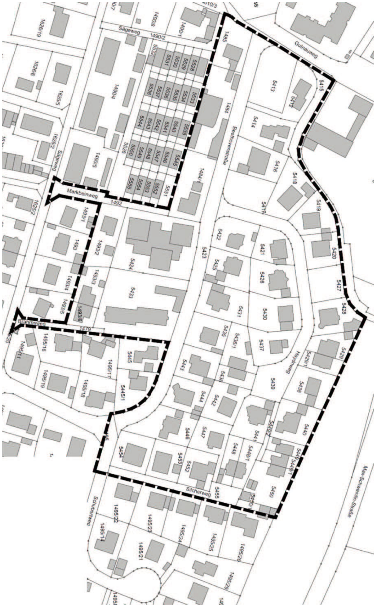
Abgrenzungsbereich für den Erlass der Örtlichen Bauvorschriften „Auf dem Markbein“