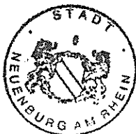
Joachim Schuster Bürgermeister