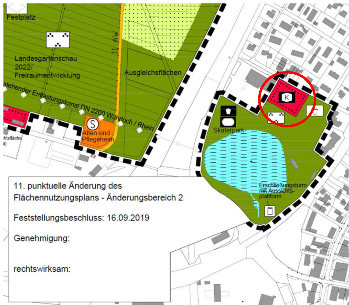
Aktueller Flächennutzungsplanausschnitt mit der Fläche für Gemeinbedarf „Kindergarten/Kindertkrippe“ (ohne Maßstab)