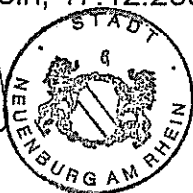
Joachim Schuster Bürgermeister