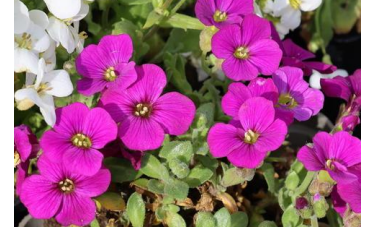
Aubrieta ,Royal Red` Blaukissen

Zur Erweiterung der Blütezeit empfehlen wir Blumenzwiebeln!