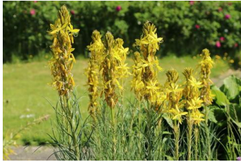
Asphodeline lutea Junkerlilie