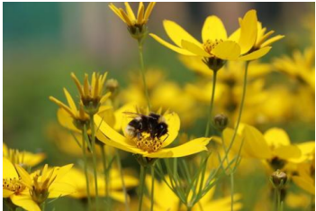
Coreopsis ,Zagreb ` Mädchenauge