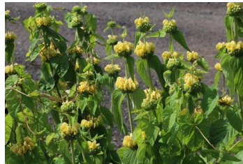
Phlox russeliana Rasselblume