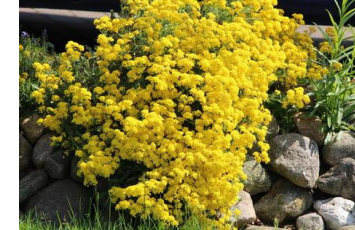
Alyssum ,Berggold` Steinkraut