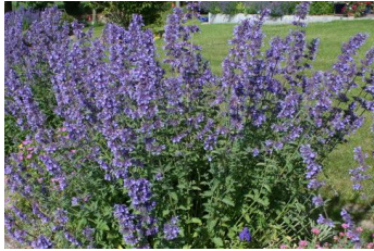
Nepeta faassenii Katzenminze