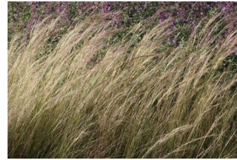
Stipa tenuissima Federgras