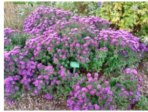
Aster novae- angilae ,Purple Dome ` Rauhblattaster