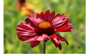
Gaillardia ,Burgunder` Korkadenblume