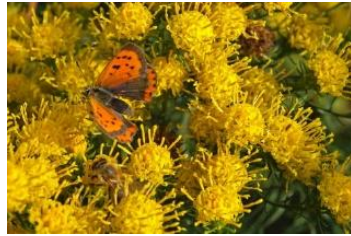
Aster linosyris Goldhaaraster