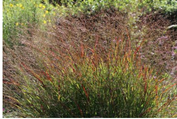
Panicum ,Shenandoah` Rutenhirse