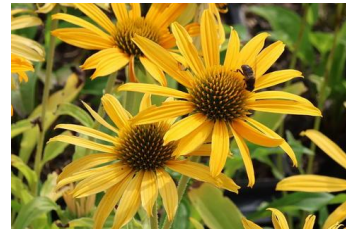
Echinacea pupurea, gelb Sonnehut