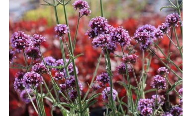
Verbena bonariensis Eisenkraut