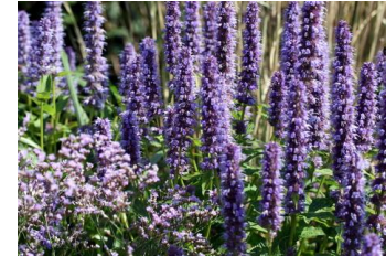
Agastache rugosa ,Blue Fortune ` Duftnessel