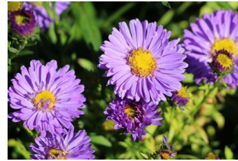
Aster dumosus, violette Kissenaster