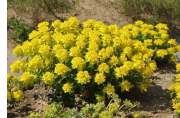
Euphorbia polycroma Wolfsmilch