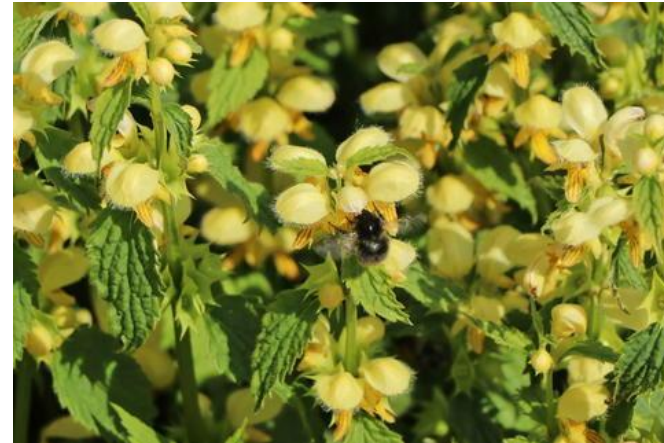
Lamiastrum galeobdolon Goldnessel