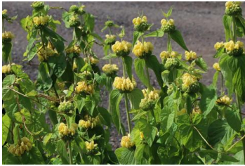
Phlomis russeliana Rasselblume