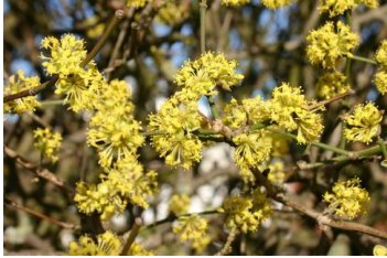
Cornus mas Kornelkirsche