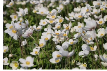
Anemone sylvestris Anemone