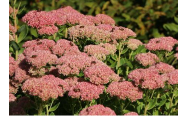
Sedum telephium Fettehenne