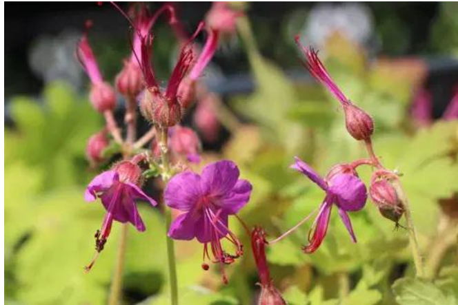
Geranium macrorrhizum Storachschnabel