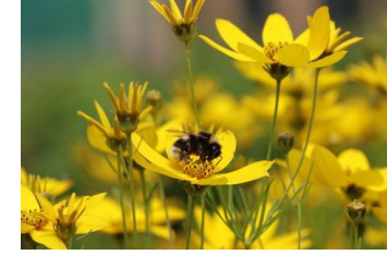
Coreopsis ,Zagreb` Mädchenauge