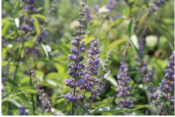
Vitex agnus- castus Mönchspfeffer