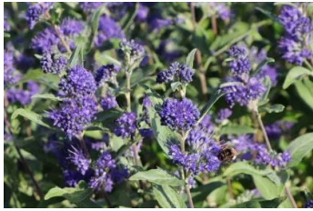
Caryopteris x clandonensis Bartblume