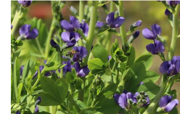
Baptisia australis Färberhülse

Zur Erweiterung der Blütezeit empfehlen wir Blumenzwiebeln!