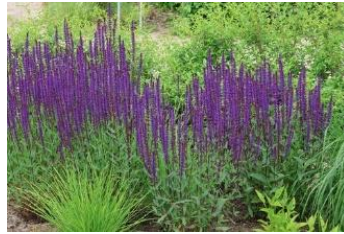
Salvia ,Caradonna ` Ziersalbei