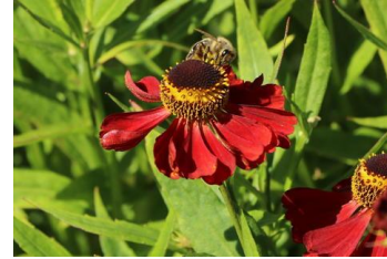
Helenium ,Rubinzwerg` Sonnebraut