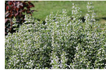
Calamintha nepeta, weiß Steinquendel