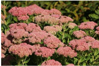
Sedum telephium Fetthenne