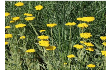
Achillea ,Coronation Gold ` Schafgarbe