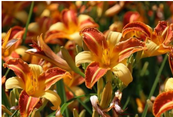
Hemerocallis ,Frans Hals` Taglilie