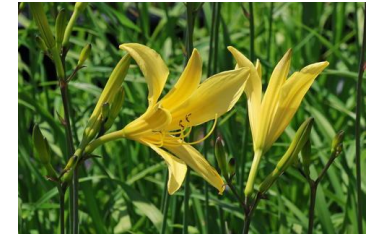
Hemerocallis citrina Taglilie