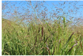
Panicum ,Heavy Metal ` Rutenhirse