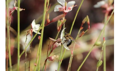
Gaura lindheimeri, weiß Prachtkerze