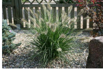
Pennisetum ,Hameln` Lampenputzergras