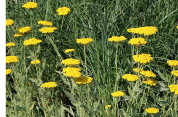
Achillea ,Coronation Gold` Schafgarbe