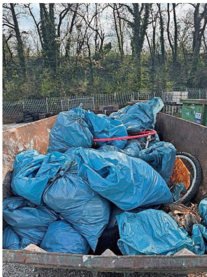
In der Kernstadt wurden insgesamt 933 Kilogramm Müll gesammelt.