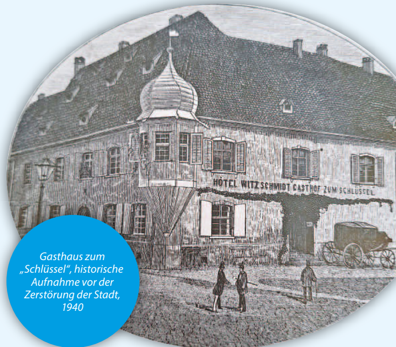
Gasthaus zum „Schlüssel“, historische Aufnahme vor der Zerstörung der Stadt, 1940