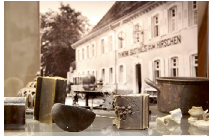
Ausstellungsstücke aus der Sammlung

Um 1525 verlor die Stadt durch ein verheerendes Rheinhochwasser die Hälfte ihres Stadtgebietes, darunter ihr Verwaltungszentrum und das Münster Unserer Lieben Frau.