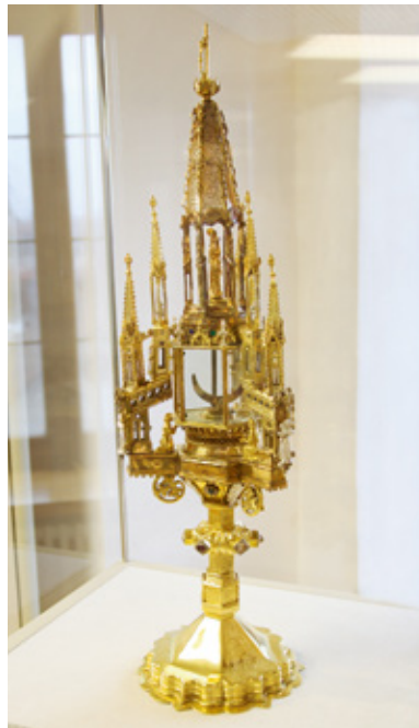
Monstranz aus dem zerstörten Münster

Dreimal wurde Neuenburg am Rhein völlig zerstört, 1675 im Holländischen Krieg, 1704 im Spanischen Erbfolgekrieg und als erste deutsche Stadt im zweiten Weltkrieg, im Juni 1940.