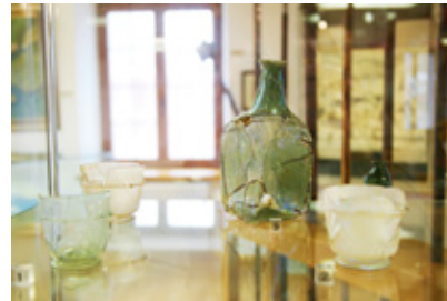
Ausstellungsstücke aus der Sammlung