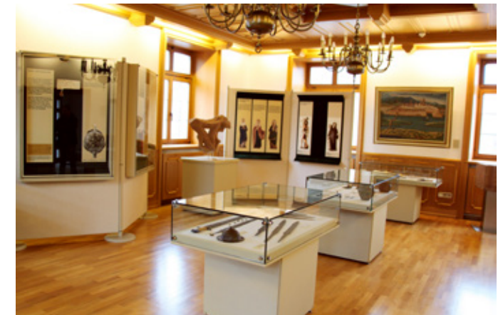
Ausstellungsraum im Erdgeschoss

Beheimatet im alten Rathaus am Franziskanerplatz zeigt das 1988 eröffnete Museum für Stadtgeschichte in einem chronologisch aufgebauten Rundgang die bedeutenden Ereignisse und Epochen der Stadtgeschichte. Gezeigt werden Exponate zur Frühgeschichte im Raum Neuenburg am Rhein, die Zeit der Stadtgründung, der Erhebung der Stadt zur freien Reichsstadt und dem 1331 erfolgten Übergang an das Haus Habsburg, dem Neuenburg am Rhein bis zum Jahr 1806 angehörte.