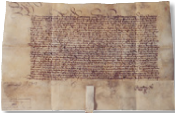
Urkunde von Kaiser Maximilian I., 1496

Neuenburg am Rhein ist eine junge und moderne Stadt mit großer Vergangenheit. Bereits um 1175 gründete der Zähringer Herzog Berthold IV. die Stadt am Rhein. Schon bald nach der Gründung erlebte das mittelalterliche Neuenburg am Rhein als Freie Reichsstadt eine große Blüte und gewann politische Bedeutung von europäischer Tragweite.