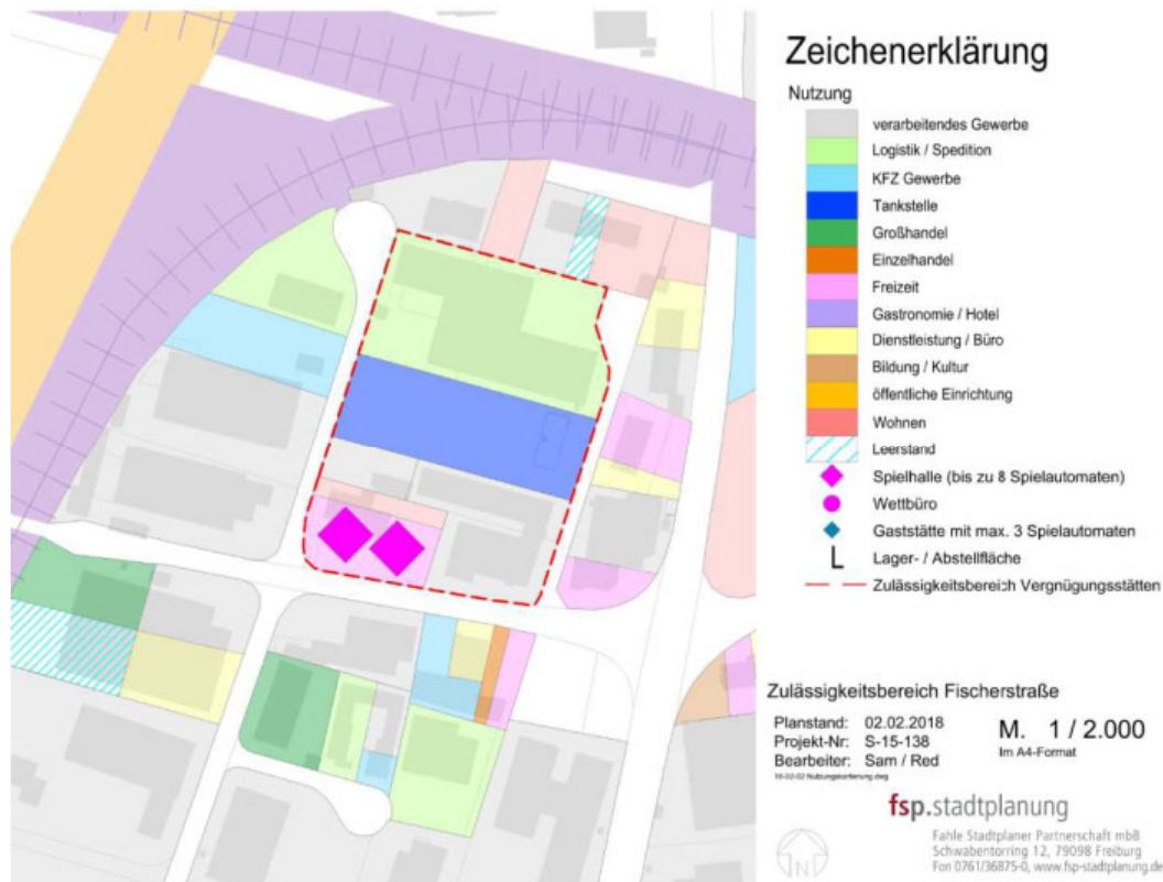
Auszug aus dem Vergnügungsstättenkonzept, Karte 23 Zulässigkeitsbereich Vergnügungsstätten Fischerstraße

Im Rahmen der Untersuchungen zum Vergnügungsstättenkonzept haben sich zwei Bereiche herauskristallisiert, in denen Vergnügungsstätten ausnahmsweise zulässig sein sollen. Neben dem Bereich „Rudolf-Diesel-Straße“ im Bebauungsplangebiet „Sandroggen“, wurde auch ein Bereich an der „Fischerstraße“ im Bebauungsplangebiet „Innere Basleren“ benannt, der sich wie folgt abgrenzt: