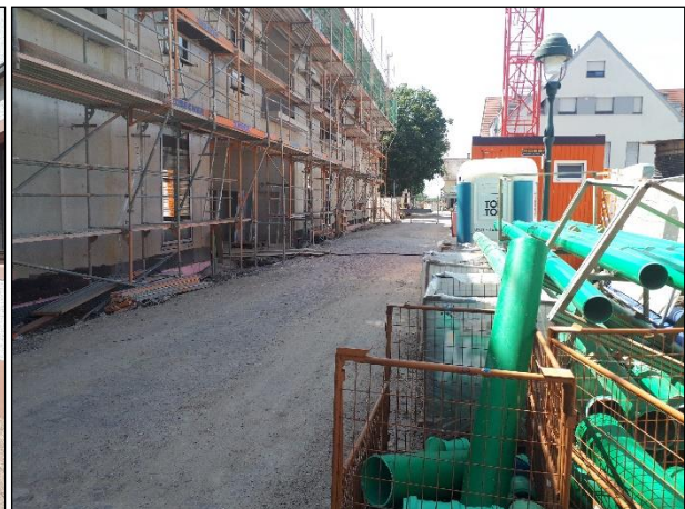
Abb. 3: Metzgerstraße mit aktueller Baustelle.