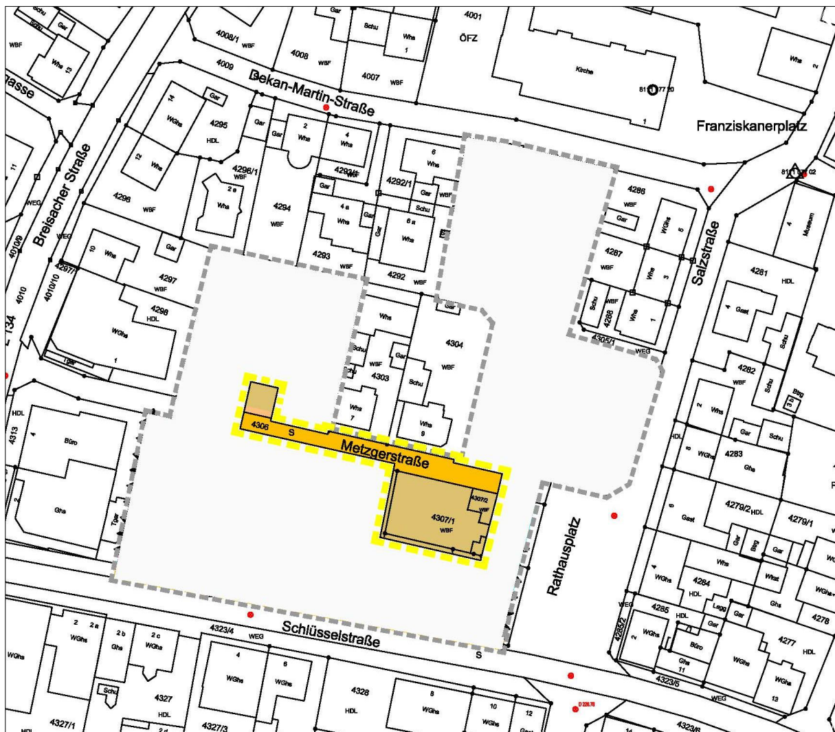
Abb. 1: Übersichtsplan mit Luftbild und Untersuchungsgebiet (gelb umrandet).

Das vorliegende Gutachten dient dazu, die Auswirkungen der Planung auf die Tier- und Pflanzengruppen hinsichtlich der Verbotstatbestände nach § 44 Bundesnaturschutzgesetz (BNatSchG) zu beurteilen.