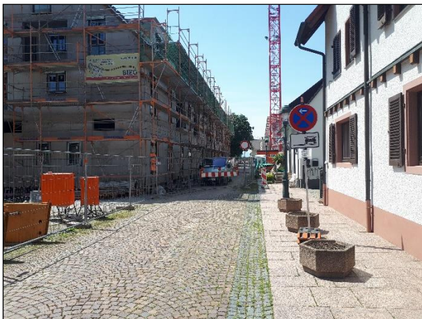
Abb. 2: Metzgerstraße (Blick Richtung Westen).

Bei dem Plangebiet selbst handelt es sich um eine ca. 0,11 ha große, naturschutzfachlich überwiegend sehr gering- bis geringwertige, teils unbebaute und innerörtliche Fläche, welche größtenteils durch von Bauwerken bestandene Flächen, gepflasterte Straßen und Lagerplätzen von verschiedenen Baumaterialien charakterisiert werden kann (s. Abb. 2 – 5). Die Vegetation im Plangebiet ist nur spärlich vorhanden und dementsprechend ausgebildet. In den Pflasterfugen besteht ein lückiger Trittpflanzenbestand mit typischen Arten, wie u.a. Deutschem Weidelgras ( Lolium perenne ), Niederliegendem Mastkraut ( Sagina procumbens ) und Breitwegerich ( Plantago major ). Innerhalb der Baustellenflächen als trockener, sandiger, kiesiger Standort hat sich kleinräumig und punktuell eine annuelle Ruderalvegetation mit Arten wie Stachel-Lattich ( Lactuca serriola ) ausgebildet.