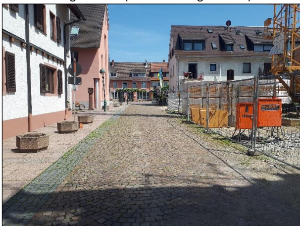
Abb. 4: Metzgerstraße (Blick Richtung Osten).