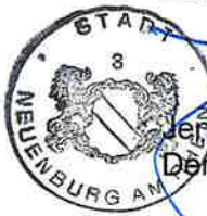
Jens Fondy-Langela Der Bürgermeister

Stadt Neuenburg am Rhein, den 19. FEB. 2025