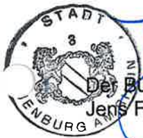
Der Bürgermeister Jens Fondy-Langela

Stadt Neuenburg am Rhein, den 17. Feb. 2025