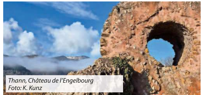
Thann, Château de l'Engelbourg