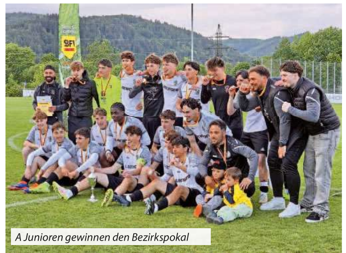
A Junioren gewinnen den Bezirkspokal

Und zuletzt noch der Hinweis, dass am 24. Juni 2026 die Generalversammlung des FCN im Clubheim stattfinden wird.