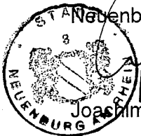
Joachim Schuster Bürgermeister