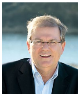
Bürgermeister Joachim Schuster