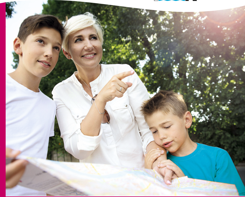
Titelbild: Fotolia © emkaphotos